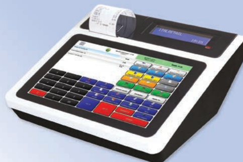
Sistema compatto all in one