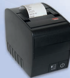
Stampante non fiscale