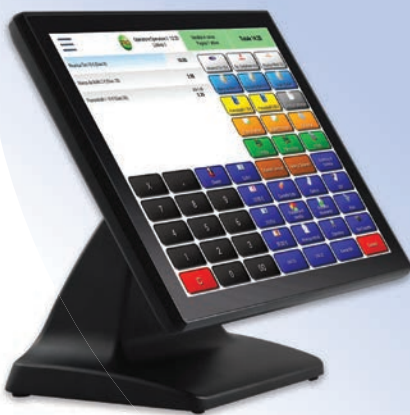
Sistema completo all in one