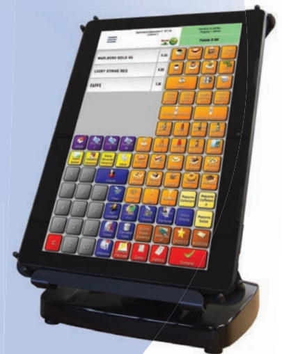
Sistema versatile da 13"